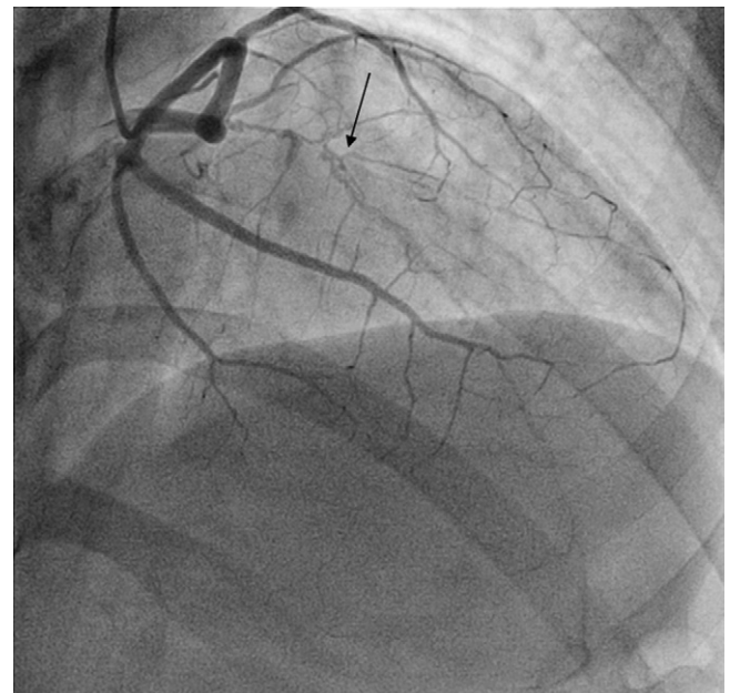
Figura 3 Studio coronarografico: la freccia indica il ramo interventricolare anteriore dell'arteria coronaria sinistra, con un'immagine di doppio lume tipica di una dissezione.

Prima della dimissione il paziente è stato sottoposto a risonanza magnetica nucleare (RMN) per lo studio della vitalità miocardica, con esito negativo per vitalità miocardica nel territorio dell'arteria interventricolare anteriore, e a test cardiopolmonare condotto durante copertura farmacologica con protocollo a rampa I interrotto a 50 W con