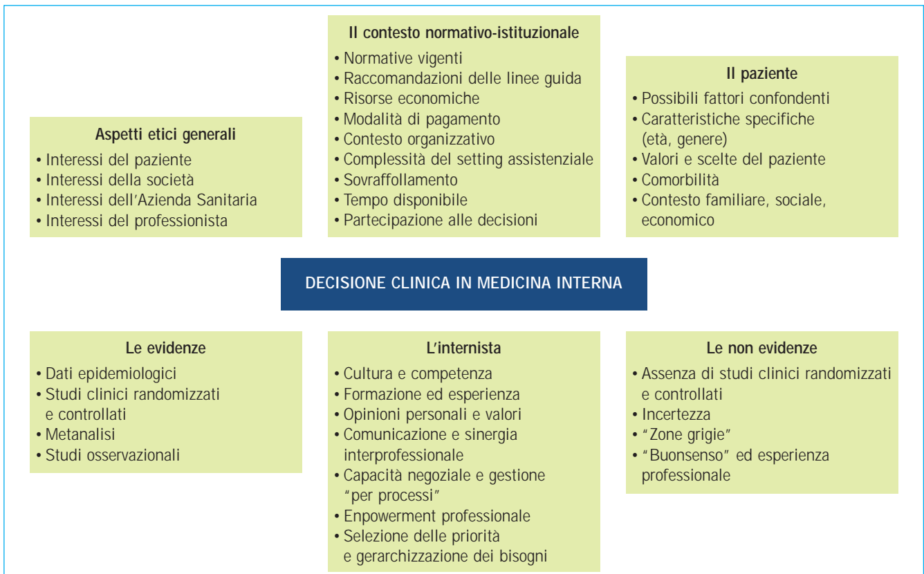
Figura 2 Complessità della decisione dell'internista nella diagnosi e nella cura: elementi in causa